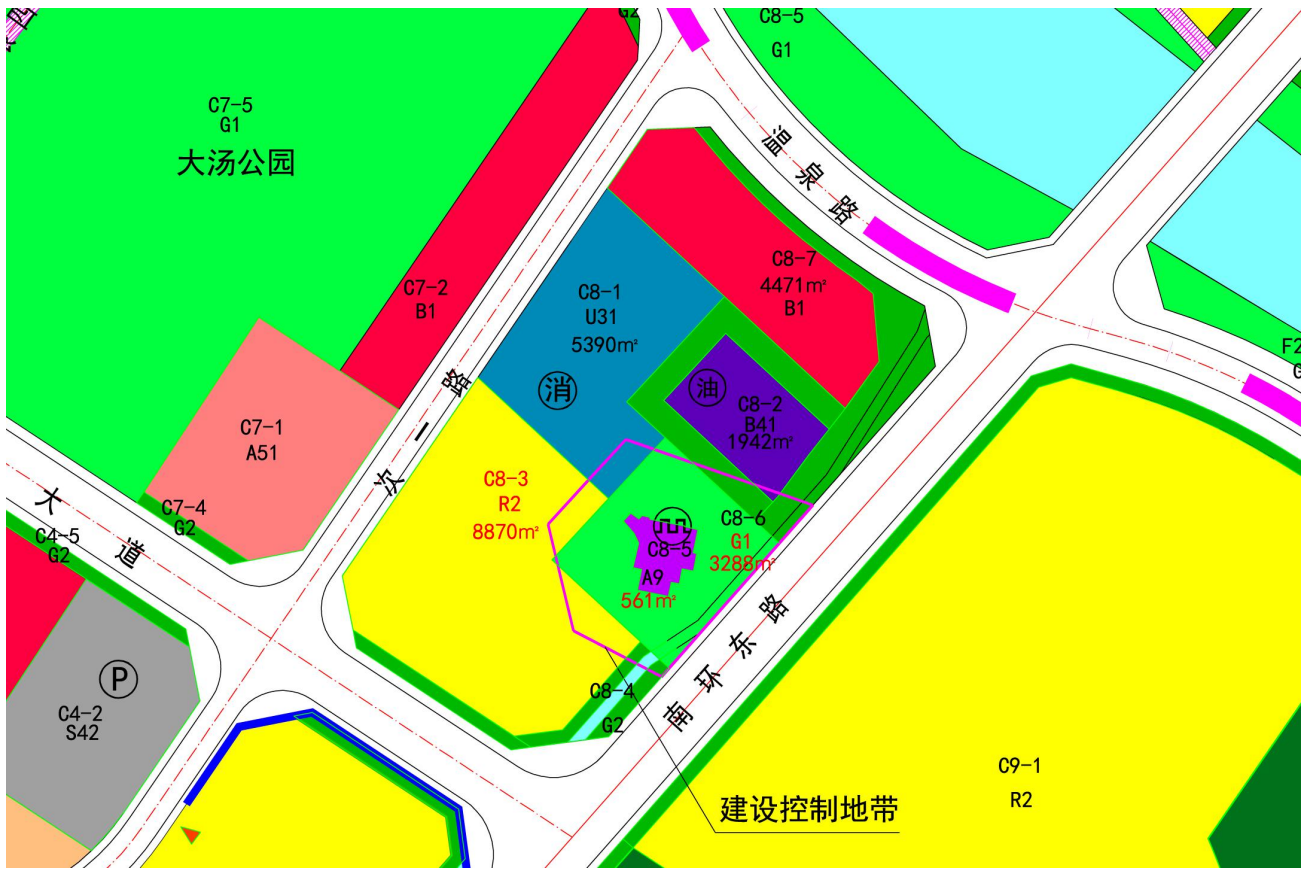
调整后主要地块规划指标表